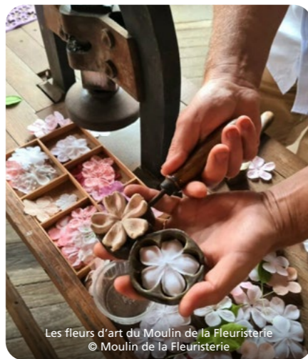
Les fleurs d'art du Moulin de la Fleuristerie

Amateurs d'art ou d'histoire, petits et grands curieux... chacun trouvera de quoi profiter avec les trésors Esprit parc national – forêts.