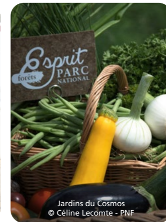
Jardins du Cosmos