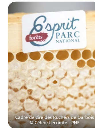
Cadre de cire des Ruchers de Darbois

Blé tendre, blés anciens, petit et grand épeautre s'épanouissent sur les terres du Parc national de forêts. Transformés localement en farines, leur qualité s'exprime dans la préparation de délicieux produits : pains au levain, brioches, pâtes fraîches.