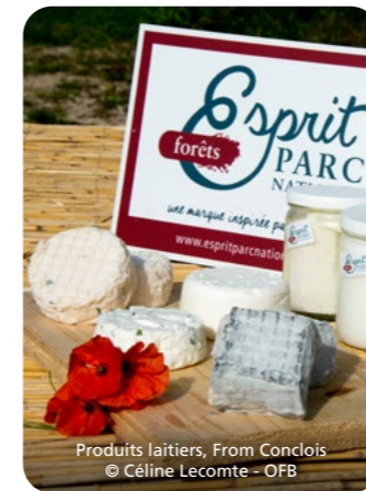
Produits laitiers, From Conclois

Depuis 2023, de nouveaux produits épicés ont fleuri : safran et produits safranés (miel au safran, fleur de sel au safran) ajoutent une saveur unique à l'offre Esprit parc national – forêts.