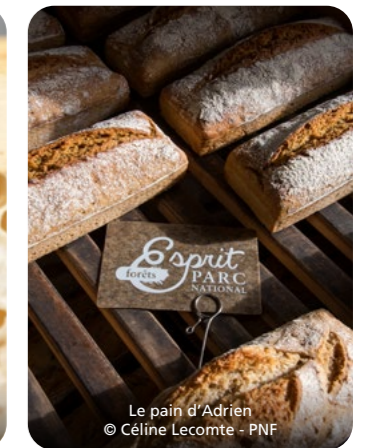
Le pain d'Adrien