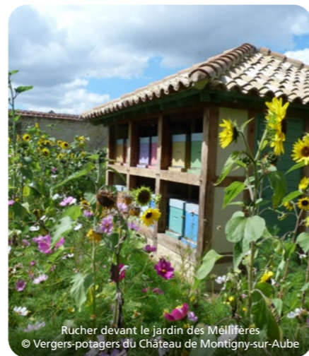
Rucher devant le jardin des Mélières