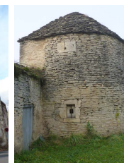
Tour d'enceinte, Recey-sur-Ource