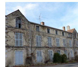
Maison de bourg, Auberive

> Consultez l'objectif 8 et l'orientation 8 du livret 2 de la charte. ●